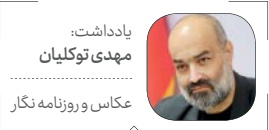
یادداشت: مهدی توکلیان عکاس و روزنامه‌نگار