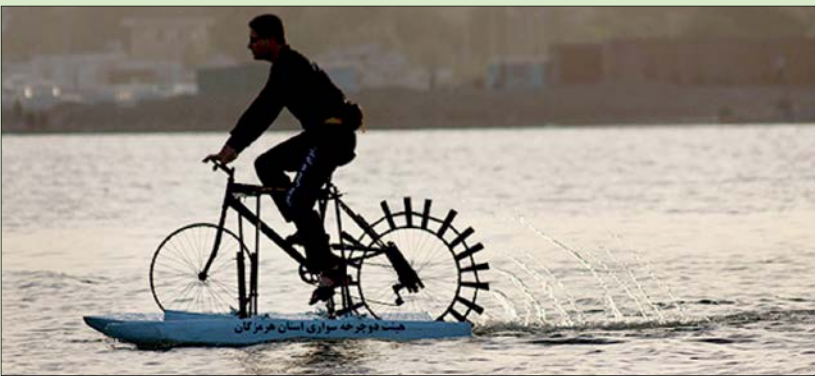
هست دو چرخه سواری استان هرمزگان

من معمولا تابستان‌ها سفر می‌کردم، یک سال هم مرخصی بدون حقوق گرفتم و رفتم سفر یک بار هم سه ماه ماموریت ورزشی به من خورد و کلا سفرهایی که رفتم به این شکل بوده، اما الان چون حدود دوسال و نیم دیگر تا بازنشستگی زمان دارم، درخواست دادم ماموریت ورزشی به من بدهند که البته هنوز موافقت نشده. چون براساس مصوبه هیات دولت اگر وزارت ورزش به شما ماموریت ورزشی بدهد همه ارگان‌ها موظفند بپذیرند و این مورد شامل حال من می‌شود. من رکوردهایی دارم که تا حالا کسی نداشته. مثلا از عمان تا ایران را یکسره شنا کرده‌ام با سال گذشته ده لیتر آب به پای‌های من وصل بود و یک قله ۲۴۰۰ متری را با دو طی کردم از پایین تا بالا که این کار در دنیا انجام نشده، سال ۹۵ هم از ساحل بندرعباس تا قله کوه گنور با بدون یک ثانیه توقف دویدم که این کار هم به خاطر اختلاف ارتفاع بین ساحل و قله تا حالا انجام نشده است.