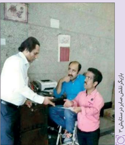
بازیگر نقش صابر در ستایش ۳

در فصل اول ستایش، صابر نقش چندان پررنگی نداشت و همسر او یا نام انیس حسابی فتنه‌انگیزی می‌کرد. با ناتوان شدن انیس، پری سیما شخصیت تازه وارد فصل دوم، آدم بد قصه شد. او با سوءاستفاده از سادگی و عقده‌های صابر این شخصیت را علیه پدرش شوراند و در نهایت به تخت فردوس تکیه زد. روند قصه از فصل دوم به بعد به گونه‌ای شد که فصل سوم بدون شخصیت صابر غیرممکن به نظر می‌رسید. اما در میانه ساخت فصل ۲ و ۳، رامسین کبریتی، بازیگر این نقش به ترکیه مهاجرت کرد و سر از شبکه‌ای ماهواره‌ای درآورد. بعد از مدتی خبر آمد او با ابراز ندامت از این شبکه بیرون آمده و به کانادا رفته است. در همین حین تولید ستایش ۳ آغاز شد و تکلیف نقش صابر برای بسیاری نامشخص ا برخی می‌گفتند بازیگری