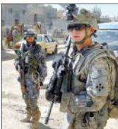
دولت آمریکا سال‌هاست با حضور اشغالگرانه خود در عراق سعی می‌کند بر زندگی و سیاست این کشور تأثیر منفی بگذارد

پس از ناکامی‌های یادشده بود که رئیس‌جمهور رژیم صهیونیستی وارد معرکه شد تا شاید بتواند بین دو ائتلاف لیکود و آبی و سفید تفاهمی به وجود آورد. بنیای اصلی این تفاهم آن است که هرکدام از طرفین حاضر شوند به صورت دوره‌ای نخست‌وزیر اسرائیل باقی بمانند. پیشنهادی که به نظر نمی‌رسد هیچ‌کدام از طرفین حاضر به پذیرش آن باشند. زیرا از يك سو نتانیا‌هو اگر نخست‌وزیر نشود باید خود را به دلیل اتهاماتش به دادگاه معرفی کند. از سوی دیگر بنی گانتس خود را برنده اصلی انتخابات می‌داند و امیدوار است بتواند به‌صورت يك نخست‌وزیر تام‌الاختیار عمل کند. این نکته کاملاً روشن است که در صورت عدم توافق طرفین يك‌بار دیگر باید در سرزمین‌های اشغالی انتخابات مجدد برگزار کرد و این امر بیش از هر چیز بی‌ثباتی و سردرگمی در راس نظام حاکم بر این سرزمین‌هاست. ]