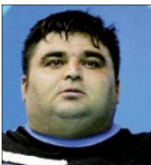
با افتادن این وزنه همه امیدهای ایران برای المپیک ۲۰۲۰ از بین رفت و نقش برآب شد

حالا و در فاصله کمتر از يك سال تا المپیک ۲۰۲۰ توکیو این نگرانی وجود دارد که وزنه‌برداری ایران در هفت وزن المپیکی ۶۱ کیلوگرم، ۶۷ کیلوگرم، ۷۳ کیلوگرم، ۸۱کیلوگرم، ۹۶کیلوگرم، ۱۰۹ کیلوگرم و ۱۰۹+ کیلوگرم روی کدام يك از سرمایه‌های‌هایش باید برای کسب مدال حساب باز کند.