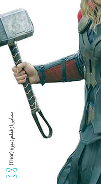
نمایش از فیلم آثور (Thor)

دوغل دنیای بازیگری رابرت دنیرو و آل پاچینو محصول شبکه جنجالی نتفلیکس است که ۸ نوامبر روی پرده سینماها می‌رود و قرار است در دور بعدی مراسم اسکار سروصدا به پا کند. 