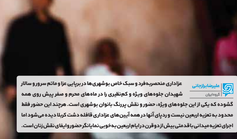
عزادری منحصربه‌فرد و سبک خاص بوشهری‌ها در برپایی عزا و ماتم سرور و سالار شهیدان جلوه‌های ویژه و کم‌نظیری را در ماه‌های محرم و صفر پیش روی همه گشوده که یکی از این جلوه‌های ویژه، حضور و نقش پررنگ بانوان بوشهری است. هرچند این حضور فقط محدود به تعزیه اربعین نیست و ردپای آنها در همه آیین‌های عزاداری قافله دشت کربلا دیده می‌شود اما اجرای تعزیه میدانی با قدمتی بیش از دو قرن در ایام اربعین به‌خوبی نمایانگر حضور و ایفای نقش زنان است.

نقش برجسته بانوان تعزیه‌خوان بوشهری در تعزیه اربعین به‌دلیل حضور پررنگ حضرت زینب(س) و مرثیه‌سرایی این بانوی قهرمان کربلا در بازگشت اسراودر کنارقبور مطهر شهدای عاشورا به طرز شگفت انگیزی به چشم می‌آید. همچنین آیین‌هایی مثل غم‌کشون در شهر خرموج و مختگ‌گردانی به یاد شش ماهه شهید دشت کربلا از دیگر مراسمی است که با نقش‌آفرینی ویژه زنان همراه است. آیینی که به خاطر جایگاه خاص‌شان در فرهنگ ایرانی– اسلامی در فهرست آثار ناملموس فرهنگی کشور به ثبت رسیده‌است.