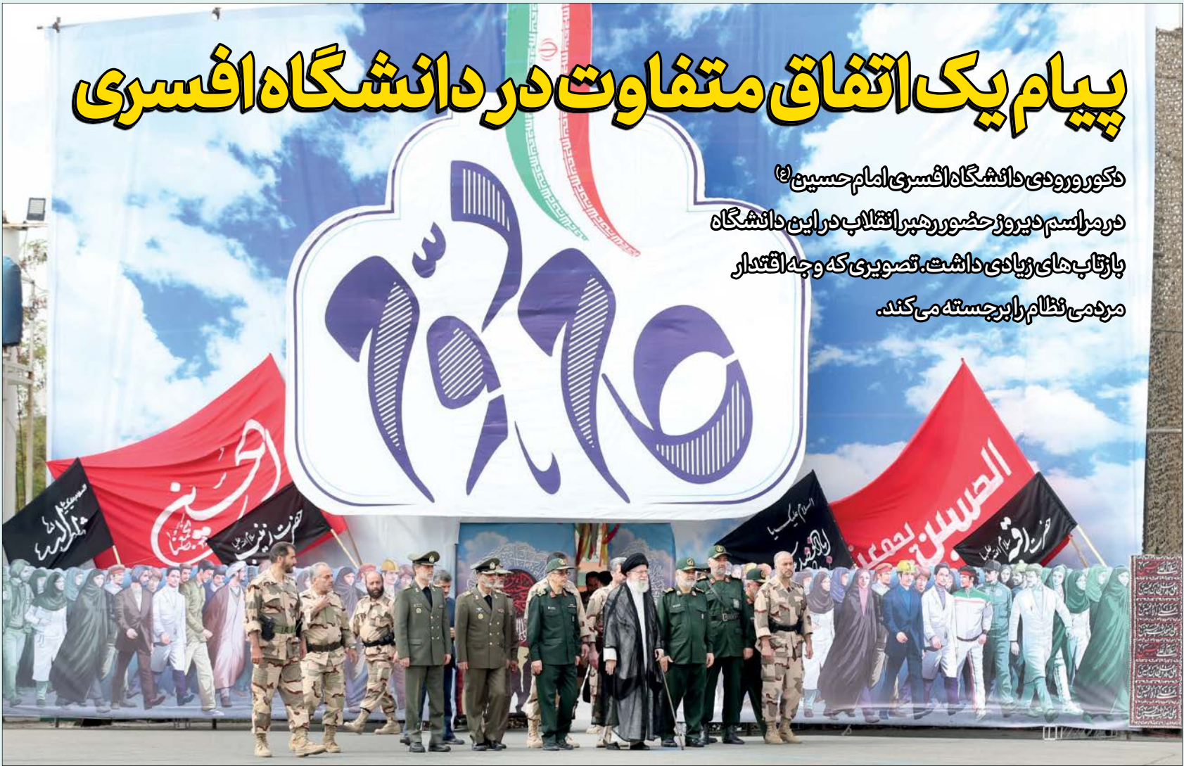
رهبر انقلاب روز گذشته از دانشگاه افسری امام حسین (ع) دیدار کرد / عکس: Leader.ir

۴ احتمالا از سال گذشته بود که دست‌اندرکاران برنامه‌ریزی مراسم حضور حضرت آیت... خامنه‌ای در دانشگاه امام حسین (ع) متوجه بُرد رسانه‌ای و فرهنگی دکور تبلیغاتی خود شدند که در میدان بزرگ این دانشگاه طراحی کرده بودند. يك دکور بزرگ، الهام گرفته از تصویر مسجد الاقصی که حالا رهبر انقلاب به همراه تعدادی دیگر از مسؤولان ایرانی از یکی از درهای آن وارد میدان می‌شدند. ترکیب و میزانشنی به دلیل جذابیت، تصویر آن به شدت در فضای مجازی دست به دست شد. عکسی که حاوی پیام مهمی بود. قدس و مسجد الاقصی برای مسلمانان است ولو آن‌که در اشغال بیگانه باشد. تصویر دکور روز گذشته هم معنادار و جذاب بود. پهنای‌اشد تا تصاویر دو سال اخیر حضور حضرت آیت... خامنه‌ای در دانشگاه افسری امام حسین (ع) را کنار هم بگذاریم و کمی راجع به آنها حرف بزنیم.