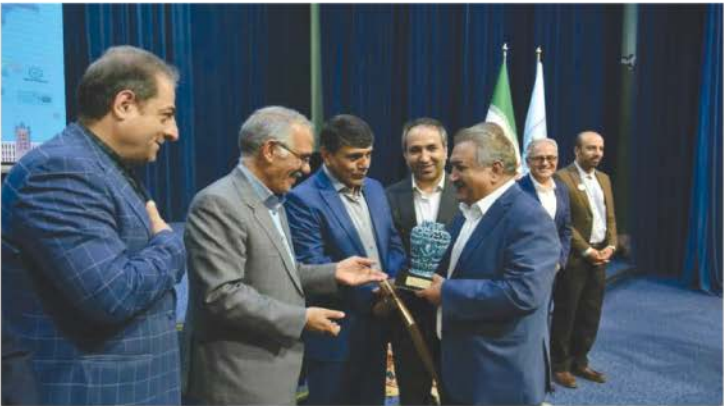
و مال مایه بگناریم.

این سرمایه‌گذار حوزه گردشگری که اکنون به گفته مدیرعامل هتل شهریار با احداث در خوش آب و هواترین منطقه تبریز است در خصوص این پروژه گفت: این کمپ در ضلع جنوب شرقی تبریز در کنار اتوبان شهید کسایی واقع شده و در دو فاز در حال احداث است. ۱- فاز اول هتلی با زیربنای ۷۸ هزار مترمربع بوده که شامل ۴۰۰ اتاق، ۶ سالن اجتماعات، آمفی تئاتر ۱۵۰۰ نفری، سالن اجلاس با آسانسور ویژه از پارکینگ تا سالن، ۶ سالن غذاخوری و کافی شاپ و صبحانه خوری در ظرفیت‌های مختلف، مرکز تجاری داخل هتل، مجموعه های ورزشی شامل استخرها، بولینگ و بلییارد و سالن های بدنسازی و SPA، اقامتگاه ویژه سران، درمانگاه و کلینیک ویژه هتل