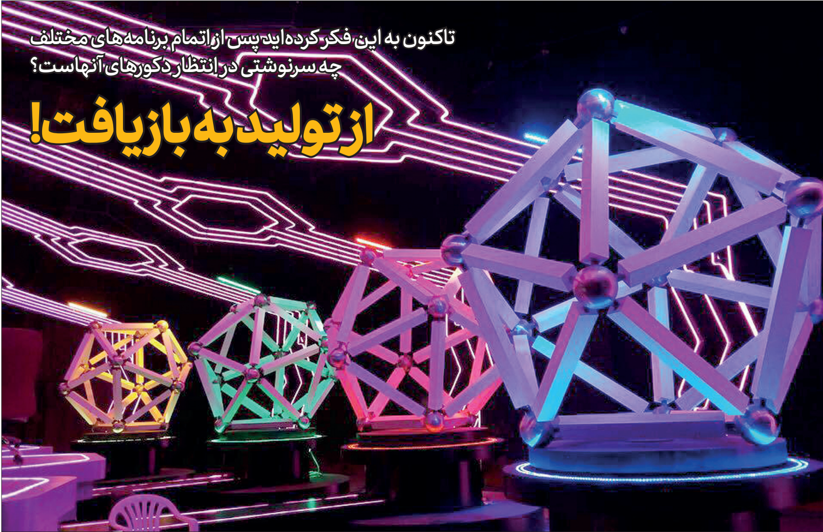
نمایی از مسابقه هوش‌باز

توجه مخاطبان قرار گرفته و عنوان دکور برگزیده را از آن خود کنند. از جمله دکور ویژه برنامه تحویل سال شبکه دو سال ۹۱ که احسان علیخانی مجری آن برنامه بود و مهدی هاشمی طراحی دکور آن را برعهده داشت. اما نکته مهم در این میان سرنوشت دکورهایی است که با هزینه‌های هنگفت و تلاش بسیار طراحان ساخته می‌شود و پس از استفاده در یک برنامه چند ماهه و حتی چند هفته‌ای به مرحله بازیافت می‌رسد و به نوعی می‌توان گفت پول‌هایی است که به هدر می‌رود. از این رو جام جم گزارشی پیرامون این موضوع داشته و با یکی از طراحان دکور پرکار و یک تهیه‌کننده گفت‌وگویی داشته که در ادامه می‌خوانید: