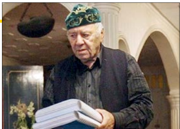
مظاهر مصفا (مرگ: ۸ آبان ۹۸)