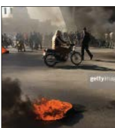
روبر انقلاب، صبح دیروز در ابتدای جلسه درس خارج فقه درباره حوادث اخیر موضعگیری کردند

هدفمند کردن مصرف بنزین طرحی بود که از سوی دولت ارائه شد و این طرح مثل هر موضوع دیگری موافق، مخالف و جنبه‌های مثبت و منفی دارد. البته این مساله به‌عنوان اصل مطرح است که باید مصرف بنزین را مدیریت کنیم و همه قبول دارند که این نحوه مصرف آثار مثبتی در انرژی و محیط زیست دارد. اما بعد از اعلام خبر افزایش قیمت بنزین در کنار اعتراضاتی که برخی مردم داشتند، عده‌ای از این فضا سوءاستفاده کردند و درصد آشوب برآمدند. یقیناً آشوب‌طلبان جزو معترضان قانونی نبودند و از این رو دستگاه‌های امنیتی و قضایی باید با آنها برخورد کنند. از سوی دیگر، دستگاه‌های نظارتی باید مراقبت کنند تا ضمن توجه به خواسته مردم، افزایش قیمت صورت نگیرد و همچنین اقبشاری که در عرصه حمل و نقل فعالند از تمهیداتی برخوردار شوند تا زمینه برای اجرای هرچه بهتر این تصمیم و کاهش تبعات آن روی اقشار کم درآمد جامعه فراهم شود. در هر صورت این طرح از سوی سران نظام بوده و مورد تأیید هم قرار گرفته است. برخی که نسبت به این مساله اعتراض دارند باید با آرامش دلایل خود را مطرح کنند و از هرگونه موج سواری که در راستای اجرای تصمیم دشمن صورت می‌گیرد، اعلام انزجار و برانث کنند و باعث شادی دشمن نشوند. دیدیم که بعد از اعلام تصمیم افزایش قیمت بنزین بنگاه‌های دروغ پراکنی دشمن بسیج شدند و با فضا سازی و انتشار فیلم‌های جعلی سعی کردند فضا را متشوش کنند. از دیگر سو، آمریکایی‌ها انتظار داشتند با فشار اقتصادی در ایران شورش به پا شود. بنابراین جاد دارد مسوولان ضمن ارائه جواب‌های قانع‌کننده در حد توانشان برای رفع اشکالات اجرای این طرح بگویند.