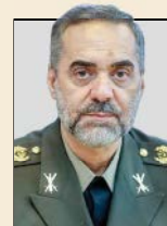
امیر محمد رضا آشتیانی وزیر دفاع و پشتیبانی نیروهای مسلح

شهید فخری زاده، شهید عرصه پیشرفت و تعالی کشور است. وی راه نجات کشور و تضمین پیشرفت و امنیت آن را در دستیابی به علم می دانست و معتقد بود استعمارگران تفکر و شیوه آن رانه تنها ربودند بلکه بقایای آن را تخریب کردند. غرب نه تنها منابع مادی بلکه منابع فکری و تفکرساز ایران را به یغما برد.