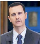
اجلاس منامه نتوانست به اهداف ضدایرانی خود جامه عمل بپوشاند

رئيس جمهور سوريه با زير سؤال بردن نمايشی که آمريکا درباره کشتن سرکرده داعش ترتيب داد، ادعاها مبني بر مشارکت دمشق در اين ماجرا را به تمسخر گرفت. بشار اسد در مصاحبه با پاريس منچ به سؤالات اين رسانه فرانسوی زبان پاسخ داد. وی در پاسخ به اين سؤال که در صورت حصول توافق با نيروهای کرد دموکراتيک سوريه و احياي کنترل