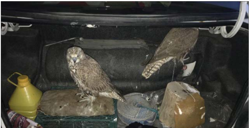
قاچاقچیان حیات وحش برای جابه‌جایی پرندگان شکاری از یک‌های آنها را می‌دوزند.

از سویی دیگر، باید توجه داشت که زنده‌گیری پرندگان شکاری از جنبه‌های گوناگونی به تنوع زیستی کشور آسیب می‌رساند؛ زیرا این دسته از پرندگان در راس هرم تغذیه قرار دارند و طیف وسیعی از پرندگان، جوندگان، خزندگان و حتی سگ‌سانان را شکار می‌کنند. بنابراین با حذف پرندگان شکاری از اکوسیستم یک منطقه، زنجیره حیات دچار اختلال می‌شود و تعادل جمعیتی گونه‌های مختلف در آن زیست‌بوم به هم می‌ریزد. همچنین انواع مختلف پرندگان شکاری در لیست کنوانسیون تجارت بین‌المللی گونه‌های جانوران و گیاهان وحشی در معرض خطر انقراض و نابودی (CITES) قرار دارند. براساس مفاد این معاهده که کشور ما نیز آن را امضا کرده است، گونه‌هایی که در لیست کنوانسیون CITES قرار دارند، باید طبق ضوابط این کنوانسیون خرید و فروش شوند؛ یعنی تجارت خارجی آنها به تایید این مرجع بین‌المللی و همچنین دریافت مجوزهای لازم از سازمان محیط زیست و اعلام نظر دامپزشک معتمد نیاز دارد. ❖