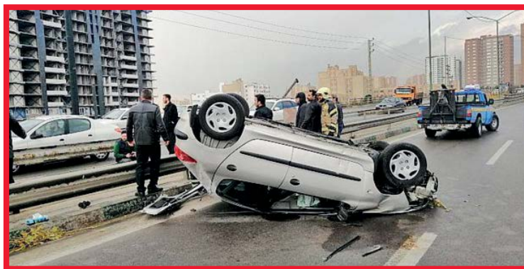
واژگونی خودروی سواری در بزرگراه بابایی / عکس: ۱۲۵