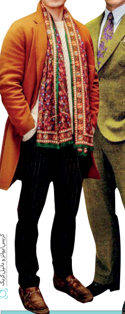
کریس ایوانز و دانیل کریگ

این راستی‌آزمایی جانمایه داستان چاقوها بیرون است.» به دنبال موفقیت بالای مالی و انتقادی فیلم، جانسون ابراز علاقه کرده که ماجراجویی‌های کارآگاه بلانش را در يك مجموعه فیلم سینمایی دنبال کند. او هم‌اکنون ایده تازه‌ای برای قسمت دوم فیلم دارد. به این ترتیب، می‌توان پیش‌بینی کرد که به‌زودی تولید قسمت‌های بعدی این کمدی درام پررمزوراز آغاز شود. ]