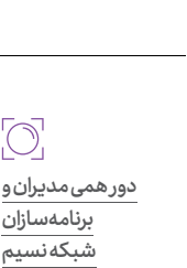
دورهمی مدیران و برنامه‌سازان شبکه نسیم