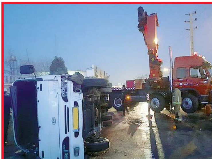
واژگونی مینی یوس در بزرگراه شهید لشکری / عکس: ۱۲۵