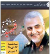
تصویری از پویانمایی ۴۰شاهد

سریال ۵۰ قسمتی «از سرنوشت» به کارگردانی محمدرضا خردمندان و علیرضا بذرافشان در سه فصل برای پخش از شبکه دوی سیما تهیه می‌شود.