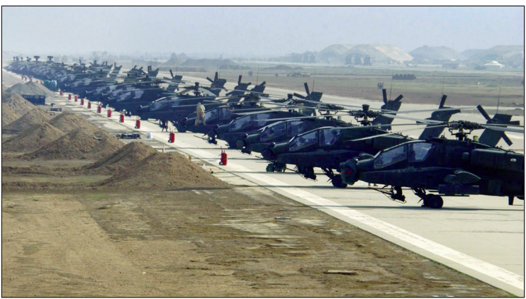
بالگردهای آتاجی آمریکا در پایگاه عین‌الاسد

پس از اشغال آن از سوی آمریکایی‌ها، این پایگاه به‌صورت يك شهر در آمده است. سال ۲۰۰۶، خبرنگار بی‌بی‌سی که درون این پایگاه رفته بود، آن را چنین توصیف کرد: «قسمتی از پایگاه