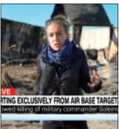
TIME EXCLUSIVELY FROM AN IRAN BASE TARGET and later's of military coverage target

ولودیمیر زیلینسکی، رئیس‌جمهور اوکراین نیز در این گفت و گوی تلفنی با تسلیت دوباره این حادثه به دولت و ملت ایران، گفت: بیانیه شما برای ما بسیار حائز اهمیت بود و رفتار قانونمند و همکاری‌های مؤثر ایران در این شرایط خاصی که برای کشورتان ایجاد شده برای ما قابل تقدیر است.