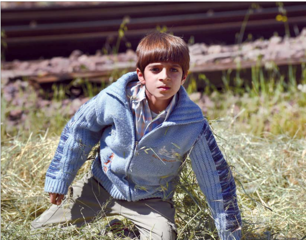
امیررضا فرامرزی در نمایی از سریال از سرنوشت

ششمین قسمت از برنامه «نسیم حیات» با موضوع «آب‌های پردازش شده» به تهیه‌کنندگی امیرحسن خواجهوی امشب، ساعت ۲۱ و ۳۰ دقیقه از شبکه پنج سیما پخش می‌شود. به گزارش پایگاه اطلاع‌رسانی سیما، نسیم حیات در این قسمت سعی دارد به بررسی کاربرد آب پردازش شده در اصلاح کشاورزی و حتی بهبود عملکرد بدن