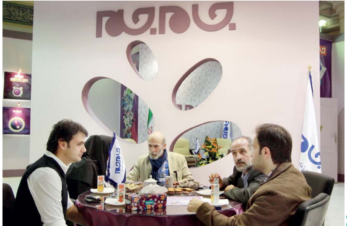
می‌گذرد بررسی سریال «کلاه پهلوی» در نمایندگان مطبوعات