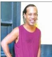
علیرضایی تردید یکی از بهترین لژیونرهای فوتبال ایران است

دین هندرسون، دروازه‌بان قرضی منچستربیونایتد در شفیلد یونایتد، تا اینجا فصل عملکرد خوبی از خودش نشان داده است، همین مساله باعث شده تا برخی هواداران تیم خواستار بازگرداندن این گلر شوند. در این میان، روزنامه دیلی میل گزارش داد مدیران منچستر پیشنهاد خود را به این گلر داده‌اند. آنها به هندرسون قول داده‌اند در صورت بازگشت به اولندترافورد به عنوان دروازه‌بان نخست فعالیت می‌کند. در غیر اینصورت حضور قرضی او در شفیلد برای یک سال دیگر تمدید می‌شود.