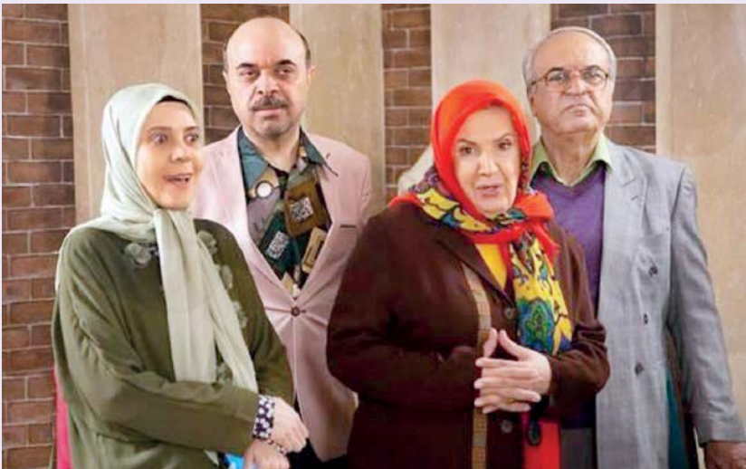
عکس: روزای عمومی سریال

یزدان فتوحی، سومین تجربه سریال‌سازی‌اش را با «میانبر» تجربه می‌کند. او توضیح داد: فکر می‌کنم