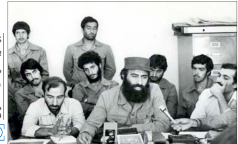
ابوشریف در حال سخنرانی

تصور ابوشریف از انقلاب اعمال حاکمیت بود. در شورای انقلاب بویژه آقایان هاشمی رفسنجانی و بهشتی تشخیص‌شان این بود که چون ابوشریف عناوینی برای خود درست کرده شاید به درد فرماندهی سپاه بخورد. البته او انسان خوبی است و بعد از گذشت سال‌های سال همچنان رفاقت من و ابوشریف ادامه دارد. اما بالاخره تشکیلات نظامی، فلسفه، علم، علم‌الاجتماع و هدف می‌خواهد و عزیزی که صرفاً کار فیزیکی بلد است لزوماً به کار تشکیلات سپاه نمی‌آید.