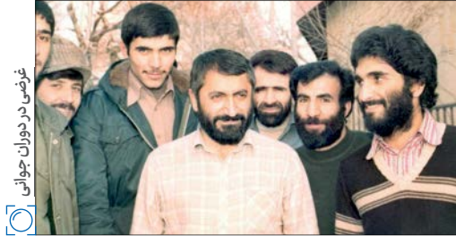
غرضی در دوران جوانی

این اسم هم ابداع من است. در آن زمان تمام تاسیسات اطلاعاتی مربوط به ساواک زیر نظر من بود و تعداد زیادی نیروی انسانی هم دور و بر من جمع بود و ما از انقلاب حفاظت می‌کردیم و بین خردمان این کلمه یعنی سپاه پاسداران انقلاب اسلامی را متداول کردیم. پسوند ایران هم از ابتدا نبود و در فرمان امام هم عنوان سپاه پاسداران انقلاب اسلامی آمده است. به محض این‌که این صحبت‌ها را خدمت امام عرض کردم ایشان با دست مبارک به شورای انقلاب نوشتند که تشکیل سپاه پاسداران انقلاب اسلامی واجب است و شما در این زمینه اقدام کنید. من این نامه را به