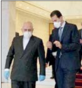
محمد غرضی از جمله

رئیس‌جمهور سوریه همچنین با اشاره به شهادت سردار سلیمانی به نقش بی‌بدیل