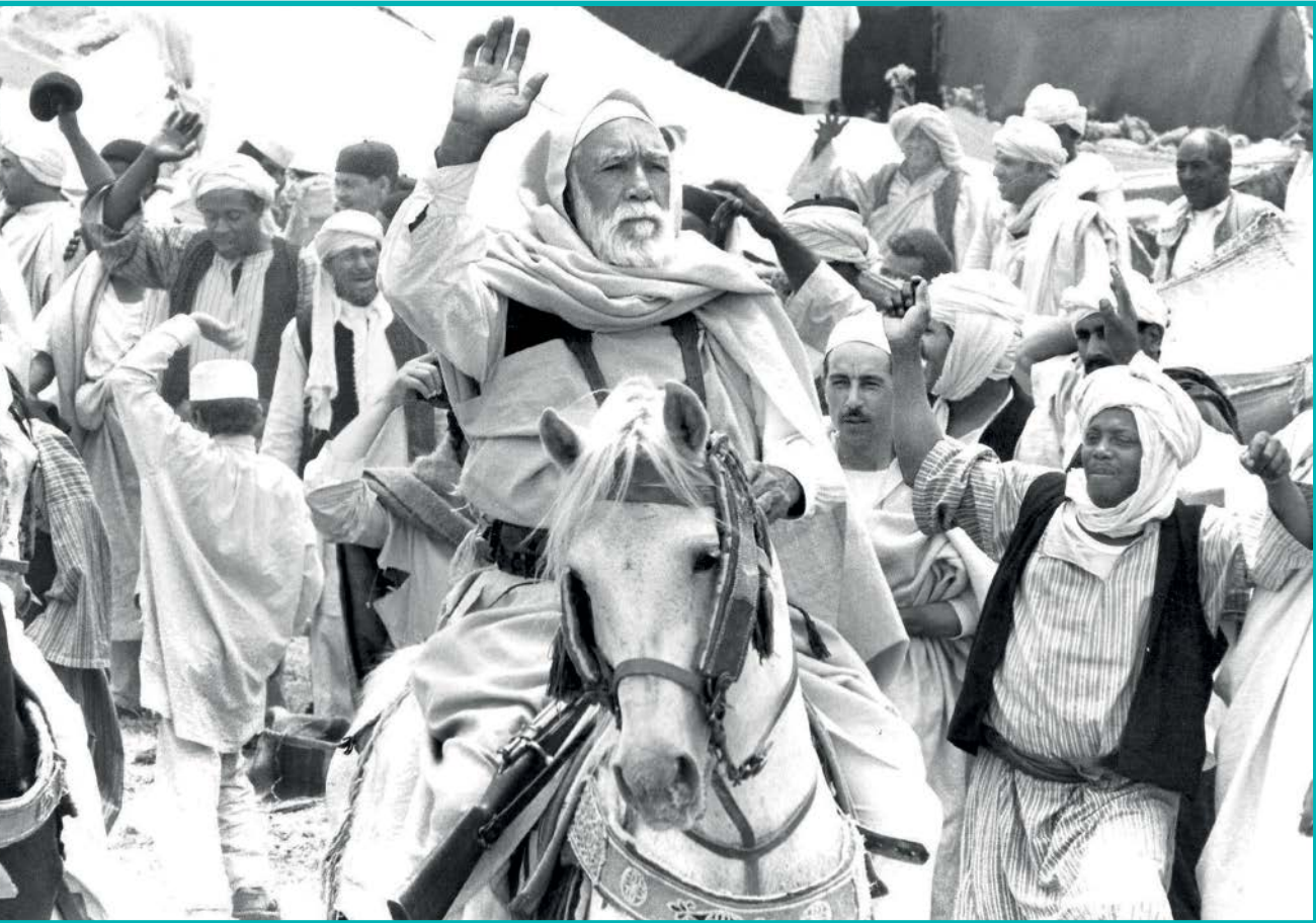
آنتونی کوئین در فیلم شیر صحرا نقش «عمر مختار» را به‌خوبی مقاومت لیبی را بازی می‌کند

لغو اکران این فیلم پویانمایی در روسیه، پخش نسخه آنلاین آخرین داستان را در سرویس‌های وی‌او دی (VOD) کشورهای مستقل مشترک‌المنافع (CIS) از تاریخ ۲۸ آوریل ۲۰۲۰ (۹ اردیبهشت ۱۳۹۹) آغاز می‌کند. آخرین داستان» تاکنون موفق به دریافت ۱۲ جایزه ملی و بین‌المللی شده‌است.