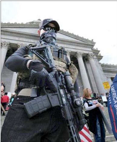
تظاهرات مسلمانان علیه قرنطینه