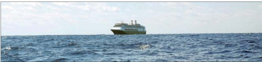
کشتی سرگردان در کرونا

هالیوود که در سوژه یابی، پشه را روی هوا نعل می کند، قبل از کرونا هم سراغ بلایای طبیعی یا حوادث تاریخی و مرگبار واقعی رفته است. یکی از قدیمی ترین فیلم های هالیوود در این زمینه، سان فرانسیسکو ساخته دیوید واراگ گریفیث و دبلیو. اس. ون دایک محصول سال ۱۹۳۶ است. فیلمی با بازی کلارک گیل و اسپنسر ترپسی