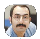
علی رستگار سینما

همین حالا هم ویروس کرونا کلی سوژه شده و از زمان شیوع آن، روز و لحظه ای نیست که در فضای مجازی، رسانه ها و میان مردم، صحبت آن نباشد. به جز مطالب جدی و انواع اندرزه‌ای مقابله با کرونا، مزاح های کرونایی و شوخی با این ویروس هم تا دلتان بخواهد وجود دارد. تقریباً هر روز، نمکی در این زمینه ریخته می شود. حالا شما فکر کنید، وقتی آب کرونا از آسیاب پیفتد و سینما فعالیت خود را از سر بگیرد، چه سوژه هایی برای فیلم سازی درباره کرونا نصیبش شده است. قطعاً همچون همیشه، این هالیوود و شرکت های بزرگ و کوچک فیلم سازی آن جا هستند که در این زمینه پیشقدم و پیشواز خواهند بود و از برکت کرونا چه پول ها که به جیب نخواهند زد. از زمان شیوع کرونا، طبیعتاً سوژه یاب های زیر و زبنگ هالیوودی و سینمایی، مشغول کارند و انواع و اقسام سوژه ها را یادداشت و بایگانی می کنند و حتماً فیلم نامه هایی هم در مرحله نگارش است. این جا و در این مجال اندک، نگاهی خواهیم داشت به برخی از سوژه های احتمالی هالیوود و سینمای جهان درباره کرونا. بعضی از اتفاقات این چند وقت، عجیب جان می دهند برای تبدیل شدن به فیلم های سینمایی جذاب و نفس گیر. هم فیلم های تلخ و جدی از آنها در می آید و هم فیلم های مفرح و کم دی. اصلاً چه بسا فراتر از این ها، این ویروس آن قدر سوژه دست فیلم سازان داده که در آینده ای نزدیک، ژانری به نام کرونا در سینما شکل بگیرد.