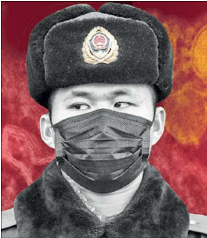
سرباز چینی با ماسک

کرونا، چه سوژه هایی دست هالیوود داده است؟