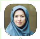
عسل اخویان طهرانی

معمولاً ترس از انگشت‌نما شدن و برچسب خوردن از جانب همکاران، از مراجعه فرد به مشاور و کمک گرفتن جلوگیری می‌کند. هرچند معضلات روحی و روانی موضوع حساسیت برانگیزی هستند و به‌سختی می‌توان به آن ورود کرد؛ اما به محض ایجاد تعامل و گفت‌وگو، افراد دست از محدود کردن خود برمی‌دارند و شروع به صحبت کردن از مشکلات‌شان می‌کنند. با استفاده از برنامه‌های سلامت آموزش محور و فراهم کردن منابع آگاهی‌رسانی مناسب