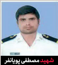
شهید مصطفی پویانفر