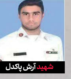
شهید آرش پاکدل