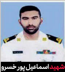
شهید اسماعیل پور خسرو