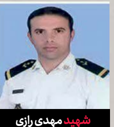
شهید مهدی رازی