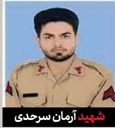
شهید آرمان سرحدی