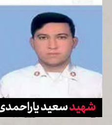
شهید سعید یار احمدی