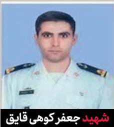
شهید جعفر کوهی قایق