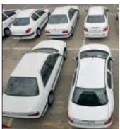
در بنادر کشور مقادیر زیادی کالاهای وارداتی به علت مشکلات ارزی دیو شده است