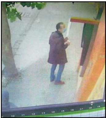
متهم هنگام بازداشت از حساب همسرش

به گزارش خبرنگار جنایی جام‌جم، ساعت ۲۰و ۲۲قیقه ییست و ششم اردیبهشت امسال زنی با مراجعه به پلیس آگاهی تهران شکایتی مطرح کرد مبنی بر این‌که خواهرش بهیار بیمارستان بوده و به خاطر اختلاف با همسرش در خانه دیگری زندگی می‌کرده، اما چند روز پیش وقتی برای دیدن پسرش به خانه آنها رفته ناپدید شده ولی خودروی خواهرش همچنان در آن خانه پارك بوده و احتمال می‌دهد بلایی سر او آمده باشد. پرونده‌ای در شعبه چهارم بازپرسی دادسرای جنایی تهران تشکیل شد و ماموران از شوهر و پسر این زن تحقیق کردند که آنها گفتند وی به خانه‌شان آمده، غذا پخته و بعد به خانه خودش رفته است. چون خانه‌اش پارکینگ نداشته خودرو را در خانه آنها پارك کرده است.