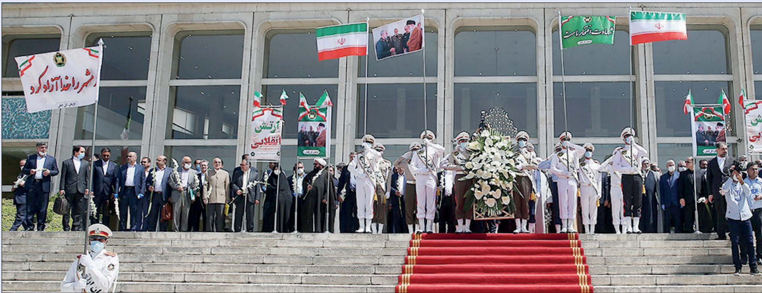
عکس: مجلس، نوروزی فردا خاله ملت

بر همین اساس، هیات رئیسه مجلس به صورت قعود و قیام، رای استمراری منتخبان درباره برگزاری جلسه علنی مجلس در روز پنجشنبه (امروز) را به رای گذاشت که با استقبال منتخبان روبه رو شد. تقوی پس از این رای گیری عنوان کرد: به دلیل این که اکثریت مجلس موافق برگزاری جلسه روز پنجشنبه هستند