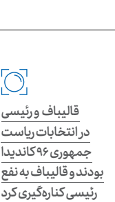
قالیباف و رئیس‌جمهوری ۹۶ کاندیدا بودند و قالیباف به نفع رئیس‌کناره‌گیری کرد