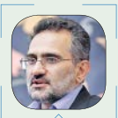
سید محمد حسینی

در مجلس می‌توان ریل‌گذاری درستی انجام داده و به این واسطه به پیشبرد بهتر امور کمک کرد و قالیباف می‌تواند در این امر مهم تاثیرگذار باشد. قوه‌قضاییه از زمانی که آقای رئیسی سکندار هدایت آن شد، شاهد تحولات خوب و برخورد قاطع با اخلاکاران اقتصادی در بخش دولتی و خصوصی بوده است. در ماجرای اخیر بحران کرونا نیز اقدامات مثبتی از جمله حبس‌زدایی و ... انجام داده است. در عین حال باید توجه داشت مجلس هم می‌تواند از جهت وضع قوانین و مقرراتی که لازم است قوه‌قضائیه را حمایت کند. رئیس‌جمهور نیز اعلام کرده با آنها همراهی خواهد کرد و امیدواریم دولت همراهی لازم را داشته باشد. هر چند زمانی این چهره‌ها رقیب هم بودند اما باید منافع ملی را بر نزاع‌های سیاسی ارجحیت داده و در کنار هم باشند.