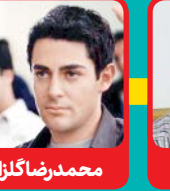
محمد رضا گلزار