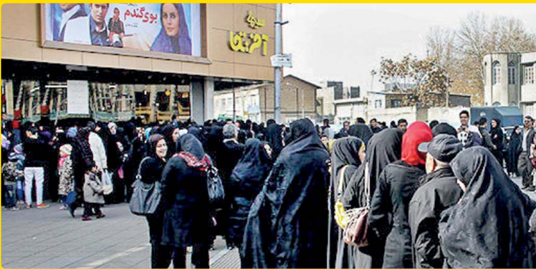
ستاره ها از دلیل استقبال تماشاگران از سینما هستند

نوار زرد پایین همین صفحه را اگر بخوانید به چند خبر مرگ می رسید. چه کنیم که این بالا هم باز باید از مرگ بنویسیم. این بار از مرگ یک شاعر؛ یاور مهربان، شاعر خراسانی. مهربان روز جمعه ششم تیر از دنیا رفته است. محمدکاظم کاظمی، شاعر، با اعلام این خبر نوشته این شاعر از مدتی پیش با بیماری سختی دست به گریبان بوده است.