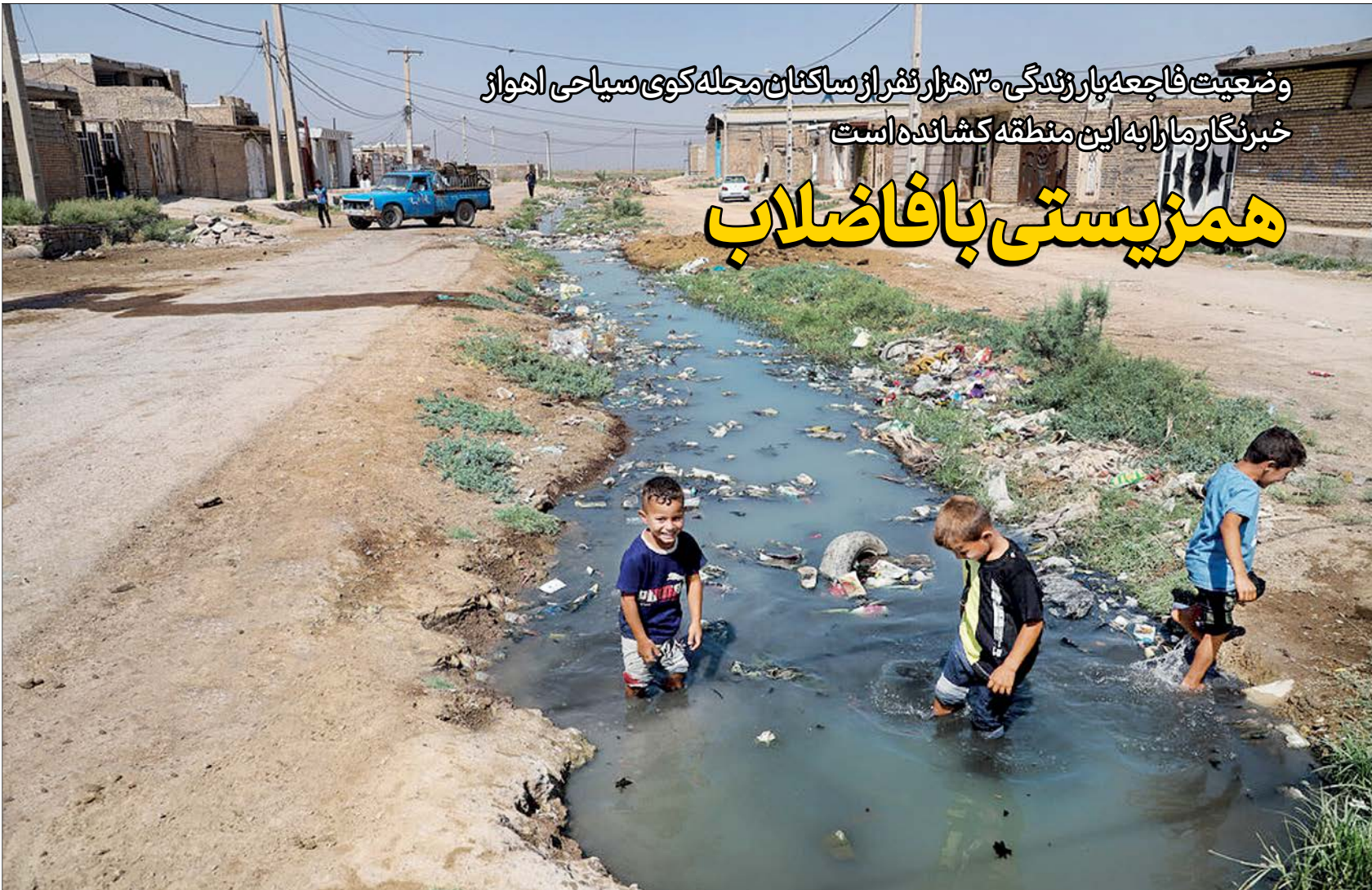
بچه‌های منطقه کوی سیاحی در حال بازی در رود فاضلاب