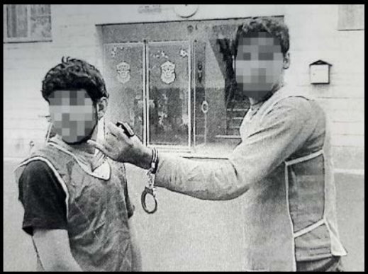
متهم در حال بازسازی صحنه قتل

سه‌سال حبس گرفت. این جوان همچنان زیر تیغ قرار داشت.