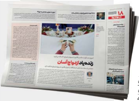
۱۴ آذر ۹۸ در همین صفحه به مسکوت ماندن قانون تسهیل ازدواج پرداخته بودندیم

قانون تسهیل ازدواج قرار بود چه کند که حالا همه از عدم تحقیقش شکوه می‌کنیم؟ این قانون که مهر تصویب سال ۸۴ را روی خود دارد شامل ۱۳ ماده می‌شود. بررسی ۱۳ ماده آن از حوصله مخاطب و البته این گزارش خارج است اما برخی از این مواد حالا به روایی می‌ماند. به عنوان مثال در ماده ۲ این قانون، «پرداخت اجاره مسکن، وام ودیعه مسکن مزدوجین از طریق صندوق اندوخته ازدواج جوانان» پیش‌بینی شده است. ماده ۳ بحث ساخت «مسکن موقت» را مطرح کرده، تا به مدت سه سال در اختیار جوانان قرار گیرد. و در ماده ۶ «کمپته سامان ازدواج» شامل مسؤولان شهری را به منظور نظارت بر اجرای این قانون در استان‌ها تعیین کرده است. همین سه ماده از این قانون اگر محقق می‌شد شاید دیگر نگرانی از وضعیت ازدواج در جامعه وجود نداشت. جالب این‌که در سایر مواد این قانون هم به دولت سه ماه مهلت داده شده که آیین‌نامه اجرایی بنویسند و هر شش ماه به کمیسیون فرهنگ مجلس، گزارش عملکرد درباره اجرای قانون بدهند و همچنین وزرای امور اقتصادی و دارایی، راه، مسکن و شهرسازی و کشور مکلف شدند که قانون را اجرا کنند.