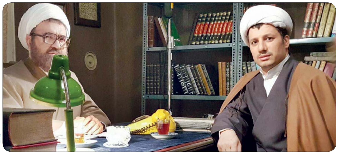
سریال معمای شاه

پیش از انقلاب روحانیت نقش موثری در زندگی مردم و مناسبات فرهنگی و هنری داشت اما به خاطر حکومت استبدادی پهلوی تأثیر روحانیت روی قوانین و مسائل حکومتی حداقلی بود. به همین خاطر سینما و تلویزیون عصر پهلوی بدون لحاظ کردن شرعیات به کار خود ادامه می‌داد تا این که انقلاب اسلامی رقم خورد. در آن زمان تصور می‌شد که امام خمینی (ره) به عنوان یک روحانی سنتی و مرجع تقلید، با سینما و تلویزیون مخالفت جدی داشته باشد اما همه این تصورات خیلی زود نقش باخت و تلویزیون و سینما بخشی از زندگی مردم ایران در دوره جمهوری اسلامی ایران شد. رفتار امام نشان داد که روحانیت و هنر هفتم نه تنها در تضاد هم نیستند بلکه با رعایت ملاحظات لازم، سینما و تلویزیون یک بستر خوب و مفید است که می‌شود از آنها به خوبی بهره برد.