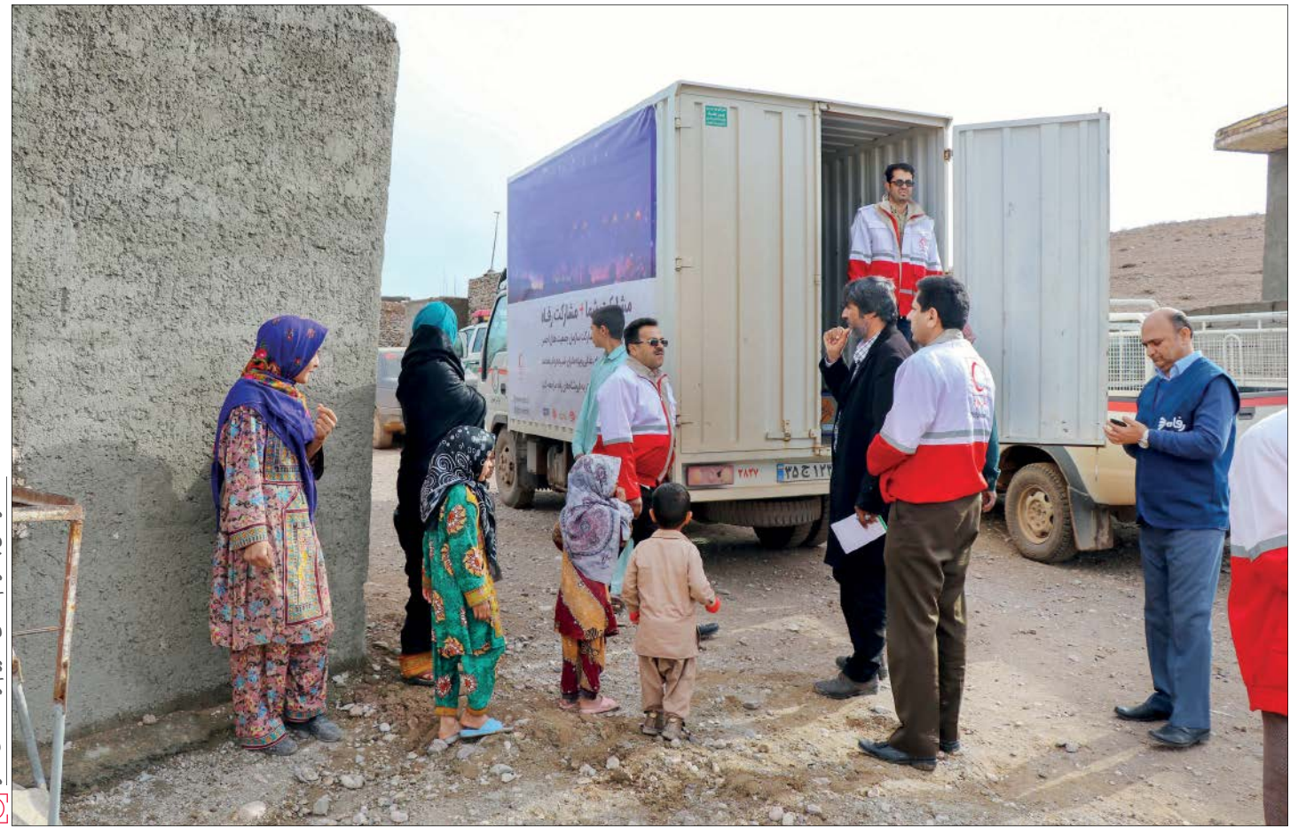
کمک‌رسانی به مردم مناطق محروم توسط هلال احمر

موسوی به مخالفت احتمالی دولت برای اجرای این قانون اشاره کرد و گفت: اگر این طرح تبدیل به قانون شود اما دولت نخواهد آن را اجرا کند، از سایر نهادها کمک گرفته و با استفاده از ظرفیت نهادهایی چون کمیته امداد، بنیاد مستضعان و ستاد اجرایی فرمان امام خمینی( ره) و... برای اجرای این قانون استفاده خواهیم کرد. اجرای این قانون برای دولت بار مالی ندارد و همه منابع آن دیده شده تا کمترین هزینه متوجه دولت باشد. /