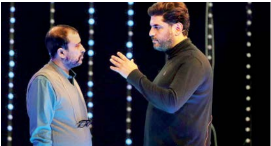
امام حسین (ع) روانه آنتن کنیم.

ترنم در فاز اول ۲۵ قسمت است که ۲۰ برنامه آن مقدماتی بوده و ۵ شرکت‌کننده در آن حضور دارند. چهار قسمت هم نیمه نهایی است که ۱۶ نفر از ۸۰ نفر راهی این مرحله می‌شوند. یک قسمت هم به فینال اختصاص دارد که چهار نفر به آن می‌رسند. تهیه‌کننده این مسابقه درباره ادامه‌دار شدن ترنم و ساخت فصل دوم برنامه بیان می‌کند: باید بازخورد برنامه را ببینیم. اگر مثبت بود و شبکه هم به لحاظ جدول پخش توانست زمانی را برای ادامه چنین برنامه‌ای در نظر بگیرد، فصل‌های بعدی ساخته می‌شود. البته اکنون با شرایط خاصی هم مواجه هستیم و با توجه به شیوع ویروس کرونا، فضایی را در استودیو پیش‌بینی کردیم که از لحاظ کرونا مشکلی برای داوران، شرکت‌کنندگان، عوامل برنامه و... ایجاد نشود.