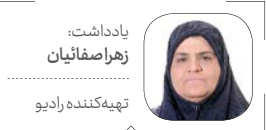
یادداشت: زهرامصفاپیان تهیه‌کننده رادیو