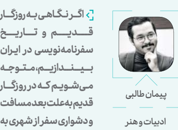
ادبیات و هنر

اگر نگاهی به روزگار قدیم و تاریخ سفرنامه‌نویسی در ایران بیندازیم، متوجه می‌شویم که در روزگار قدیم به علت بعد مسافت و دشواری سفر از شهری به شهر دیگر، قالب سفرنامه باقیال بیشتری از سمت نویسندگان روبه‌رو بوده و قلم به‌دستان بیشتری بوده‌اند که در این قالب قلم‌فرسایی می‌کردند. اما امروزه شاید به علت سهولت سفر یا وجود اینترنت و فضای مجازی برای باز نشر اطلاعات يك سفر، قالب سفرنامه چندان چون قبل مورد استقبال قرار نمی‌گیرد.