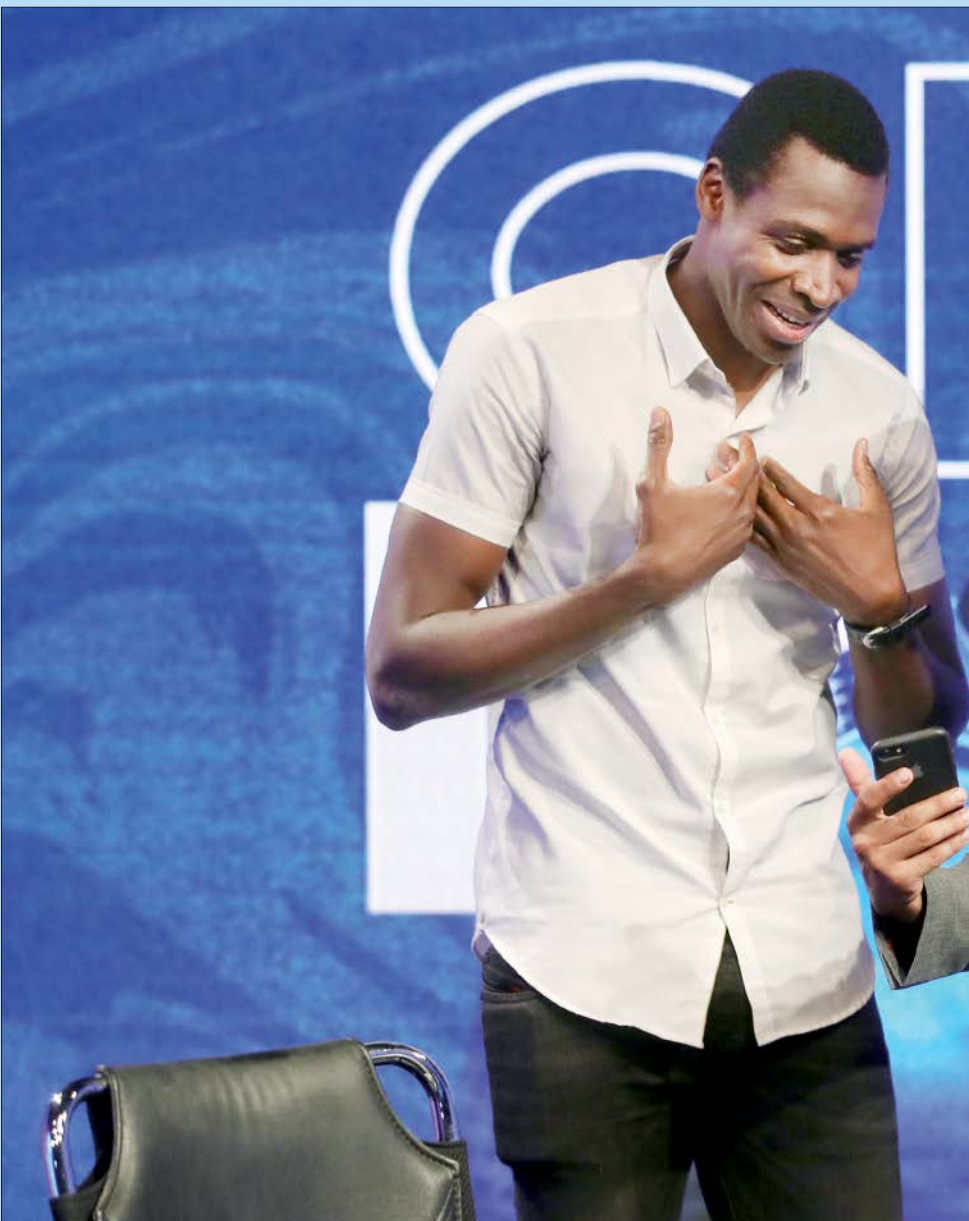
در ادامه هفته گذشته با شیخ دیپاک، یکی از یوزا در دیدار بین برنامه‌های فوتبال برتر در فضای مجازی بود.

می‌کند ولی برنامه روز به روز محبوب‌تر می‌شود