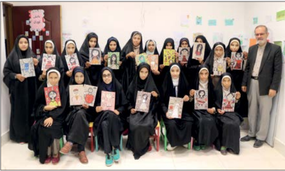
محمد حسین صلاتیان / تصویرگر