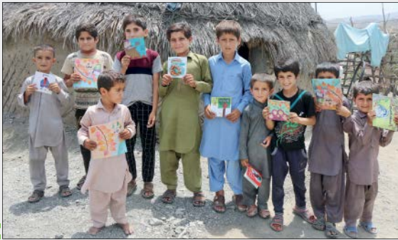
خوشحالی پس از دریافت کتاب داستان