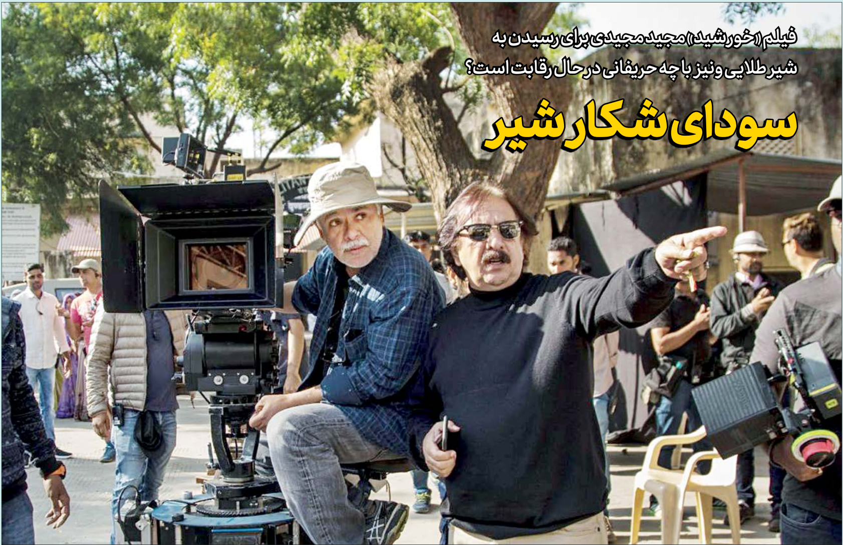
«خورشید» آخرین ساخته مجید مجیدی در جشنواره و نئیز به رقابت با فیلم‌های جهانی می‌پردازد

و نئیز، ۸ فیلم را خانم‌ها کارگردانی کرده‌اند که رقم و حضور قابل‌توجهی است؛ گرچه ممکن است انتخاب این آثار ربطی به کیت بلانشت (بازیگر استرالیایی‌هالیوود) رئیس هیات داوران این دوره نداشته باشد و سلیقه و نظر آبرتو باربیرا، مدیر جشنواره و نئیز در این میان دخیل و موثر بوده باشد، اما احتمالا این گمانه‌زنی تقویت می‌شود که شاید بلانشت هم به این حضور قابل‌توجه بی‌اعتنا نباشد. آنچه می‌تواند در این زمینه، بیش از پیش کارگردان‌های مرد این دوره از جمله مجید مجیدی را نگران کند، دیدگاه‌های فمینیستی بلانشت است. یکی از مصداق‌های این دلواپسی احتمالی