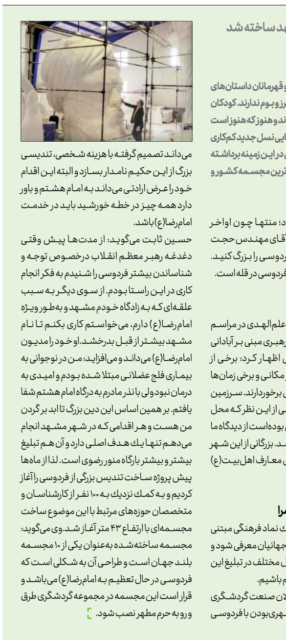
بزرگ‌ترین تندیس نگهبان زبان و ادب پارسی به ارتفاع ۴۳ متر از ساخته شد

خوشبختانه کارشناسان سازمان مدیریت و برنامه‌ریزی آذربایجان شرقی مطالعات گسترده‌ای بابت دلایل مهاجرت شهروندانشان به‌ویژه نخبگان به سایر مناطق کشور انجام داده‌اند و مدیر این سازمان می‌گوید بر اساس این مطالعات، بروکرسی مضاعف و روال پیچیده و سخت اداری یعنی اعمال قوانین دست و پاگیری ساختگیزی بخش‌های دولتی و اداری در برابر شهروندان، روند سرمایه‌گذاری و فعالیت‌های اقتصادی را دشوار کرده‌است، طوری که زمان دریافت تسهیلات بانکی در استان گاه تا چند برابر استان‌های دیگر از جمله مرکز کشور است و همین باعث فرار سرمایه‌گذار از استان می‌شود. 📌