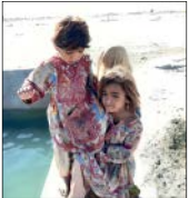
چند سال قبل یکی از کودکان روستای عیسی بازار در منطقه پلان چابهار در این هوتک غرق شدند

❖ آب که به شش روستا برسد، در واقع کار شما هم در منطقه به پایان می‌رسد؟ راستش نه، همین حالا یکی از خیرین که متوجه نوع کار ما در منطقه شده، آمده پای کار و صد میلیون تومان گذاشته وسط و ما به دنبال شناسایی چند روستای دیگر در بخش کنارک یا دشتیاری هستیم تا طرح آبرسانی را در آنجا شروع کنیم. تا زمانی که خیرین مردم و مسؤولان پای کار باشند، ما در منطقه می‌مانیم و روی تعهد خود برای رساندن آب شرب به هموطنان بلوچ هستیم. ❖