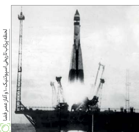
سرگنی پاولویچ کارالیف